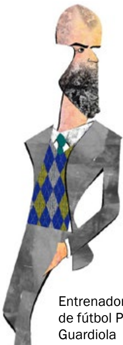
Entrenador de fútbol Pep Guardiola